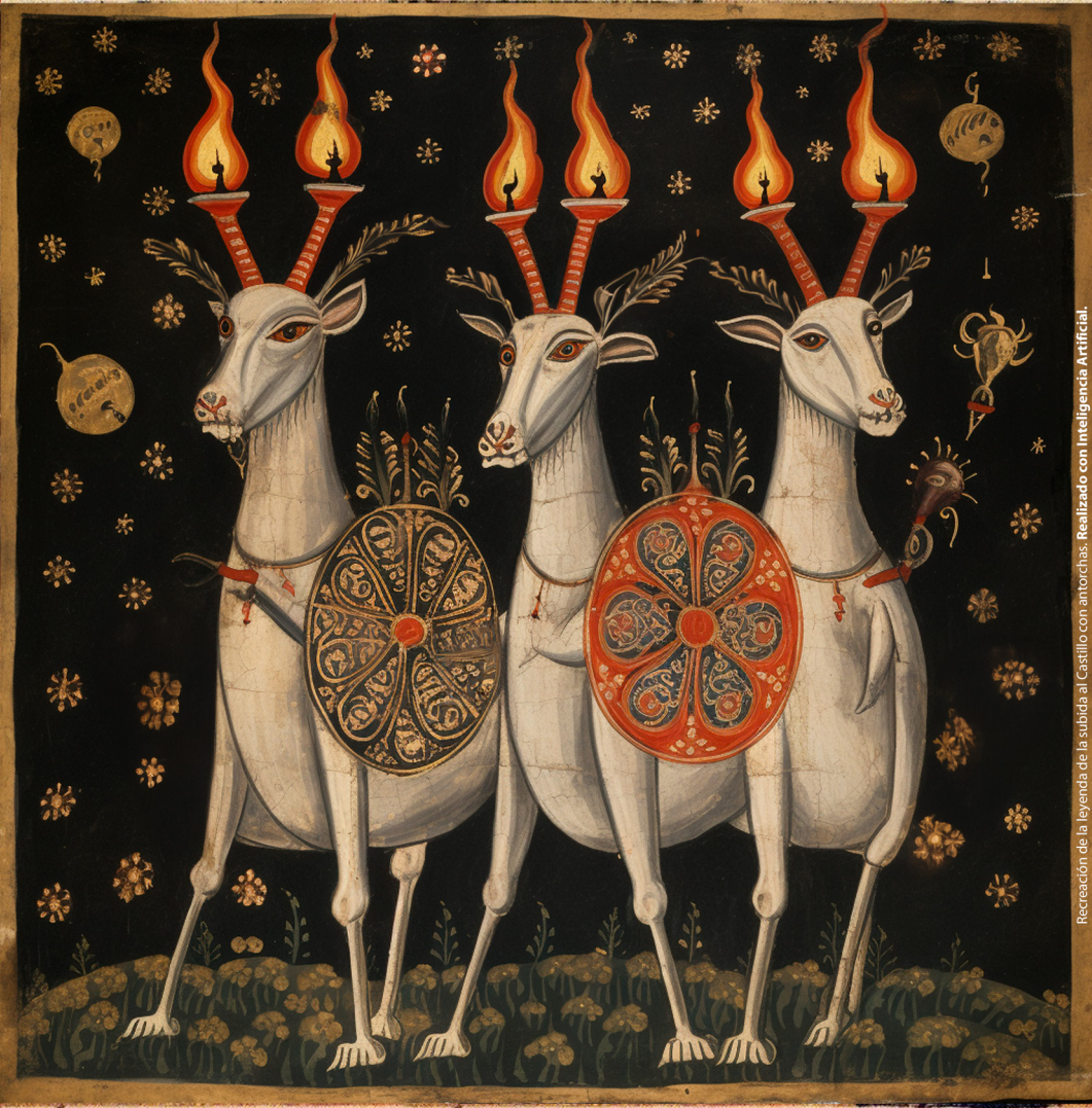
Recreación de la leyenda de la subida al Castillo con antorchas. Realizado con Inteligencia Artificial.